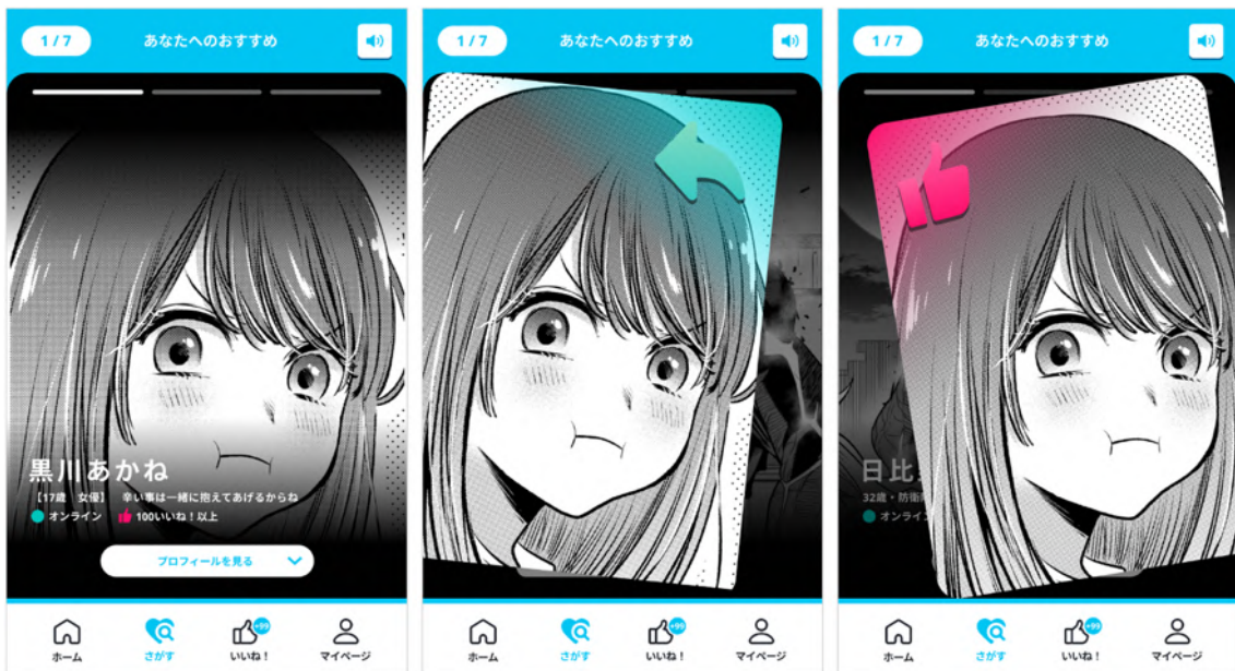
『【推しの子】』 ©赤坂アカ×横槍メンゴ／集英社

日々様々な作品が発表され人気のマンガが世の中にひしめく中、「スキマ時間でサクサク体験できるライトなマンガ探し」をコンセプトに、集英社と共同で企画を立案。マッチングアプリから着想を得た UX 設計となっており、体験画面に表示されるキャラクターを右（いいね！）にスワイプすることでキャラクターを選択。気に入ったキャラクターはその場でプロフィールを確認したり、登場する作品を無料で試し読みすることができます。